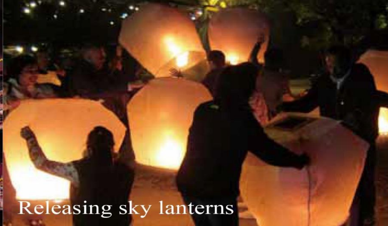
Releasing sky lanterns